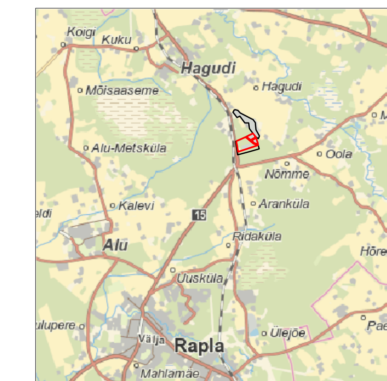
Kaardileht nr 631 Rapla, 632 Türi